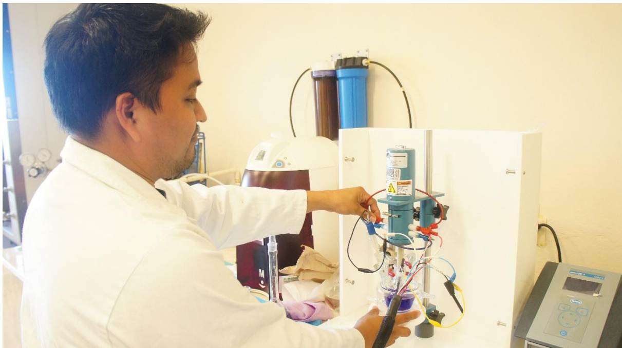
Electrodo de disco rotatorio, marca: Pine con controlador de velocidades.