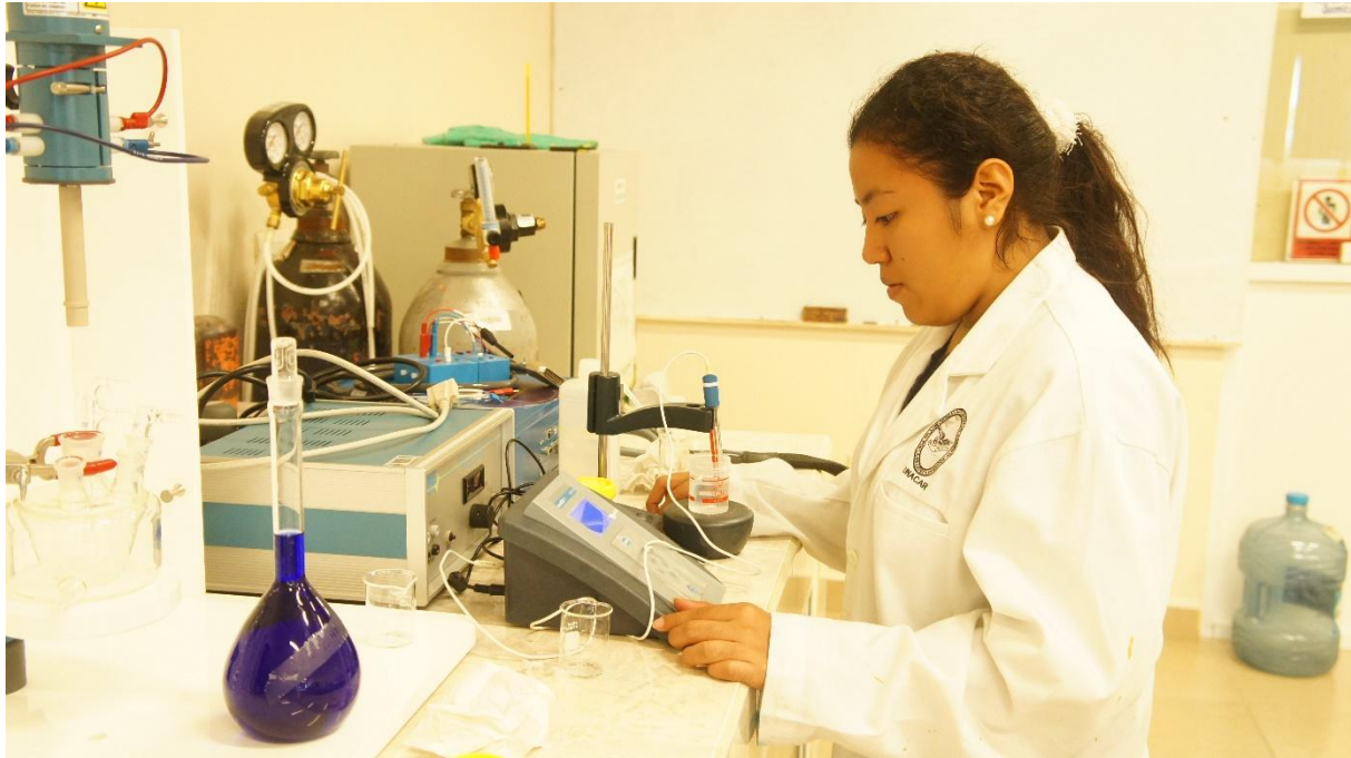
pHmetro, marca Hach.