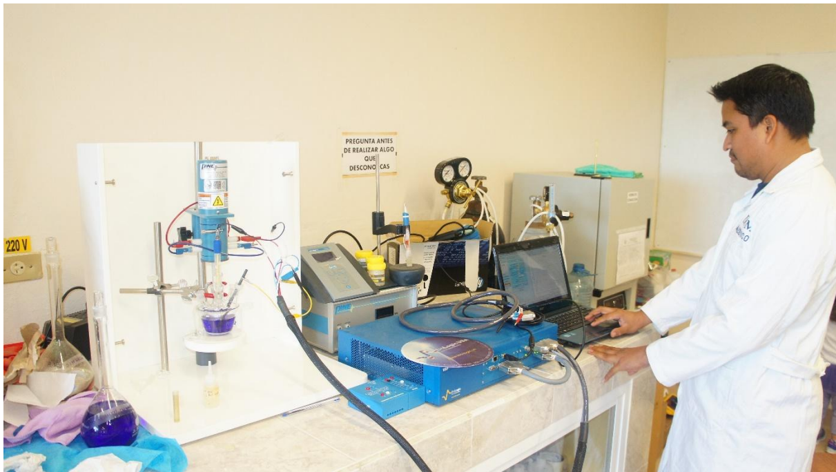
Potenciostato/Galvanostato, marca: Biologic